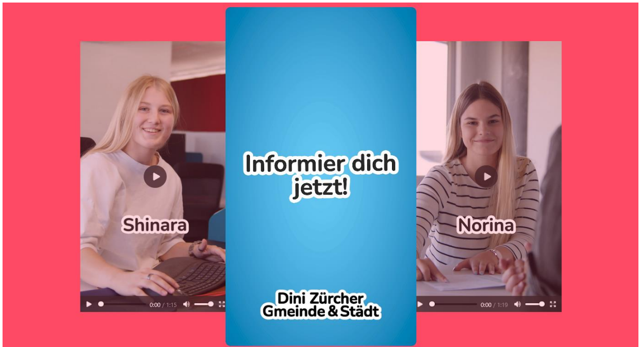
(Screenshots der «Landingpage-Videos» und der «TikTok Videos»)

Die Landingpage ist mit ihrem modernen Design speziell auf die Zielgruppe ausgerichtet und soll aktuelle Sekundarschülerinnen und Sekundarschüler ansprechen. Die Seite enthält Videos ,